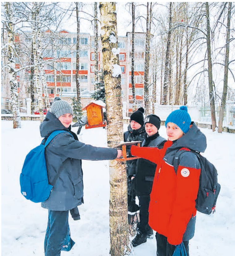
Ученики гимназии развесили кормушки

Водоплавающим птицам понравится нежирный творог с панировочными сухарями и злаки, также для подкормки подойдет перловая каша.