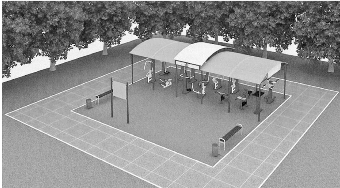
Проект по обустройству спортивной площадки в д. Железково

Затем для делегатов был показан прекрасный предновогодний концерт, подготовленный коллективом Плавковского сельского Дома культуры под руководством художественного руководителя Светланы Ильиной.