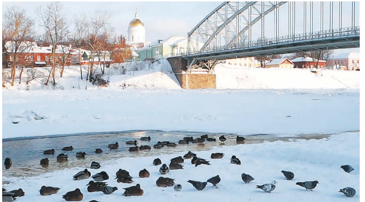
Утки остались зимовать на Мсте