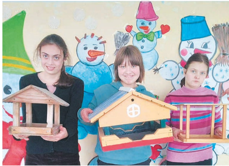
Заботу о пернатых проявили ученики адаптированной школы № 1

По данным учёных, в сильные морозы погибает до 90% синиц. Но можно помочь им пережить это время, организовав подкормку, повесив за форточкой простую кормушку из пластиковой бутылки, ведь зимняя подкормка птиц очень важна и помогает сохранить как обычные, так и редкие виды птиц.